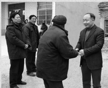
▲省工商联党组书记徐发成率队赴怀远县走访慰问贫困户